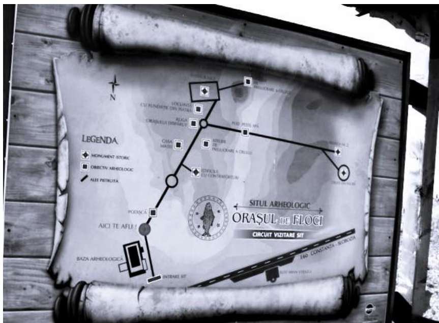
Harta Sitului arheologic de la Orașul de Floci