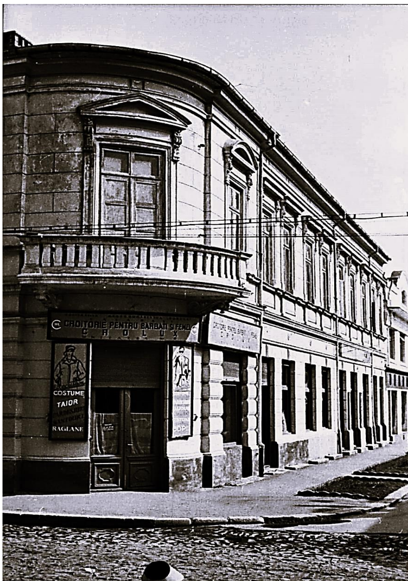
Casa Scarlat Doicescu, construită în 1880, unde în perioada 1881-1896 a funcționat Prefectura județului Ialomița. Apoi localul a devenit Hotelul Doicescu, fiind naționalizat în 1950, aici instalându-se o croitorie și Magazinul „Doi Iepurași”