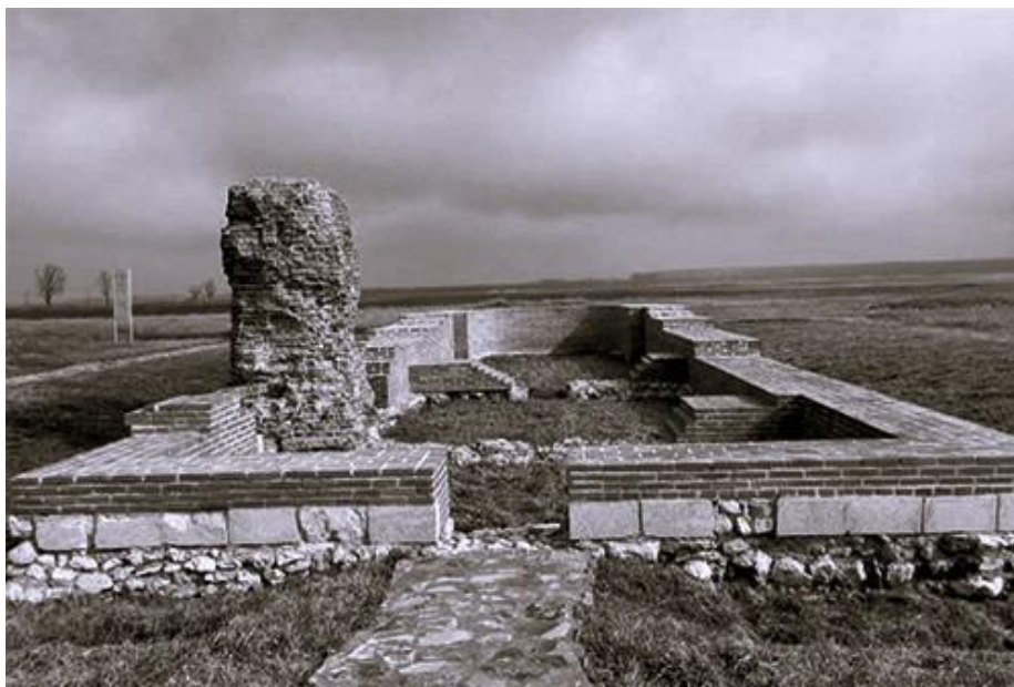
Urmele a două biserici din cele trei pe care arheologii medievali le-au identificat la Orașul de Floci, prima capitală a județului Ialomița