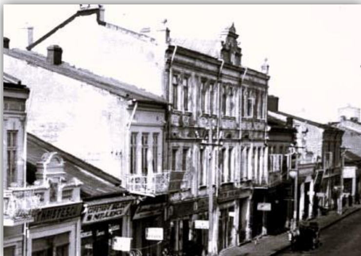
Fostul Hotel Royal, cunoscut de călărășeni sub numele de Hotel Arcadia. A fost demolat prin 1980, pe locul lui aflându-se astăzi Blocul Arcadia, la parterul căruia funcționează Secția de Artă populară a Muzeului Dunării de Jos