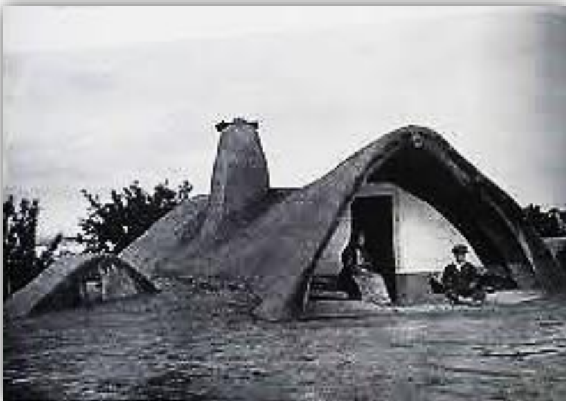
Bordeiele Bărăganului de altădată