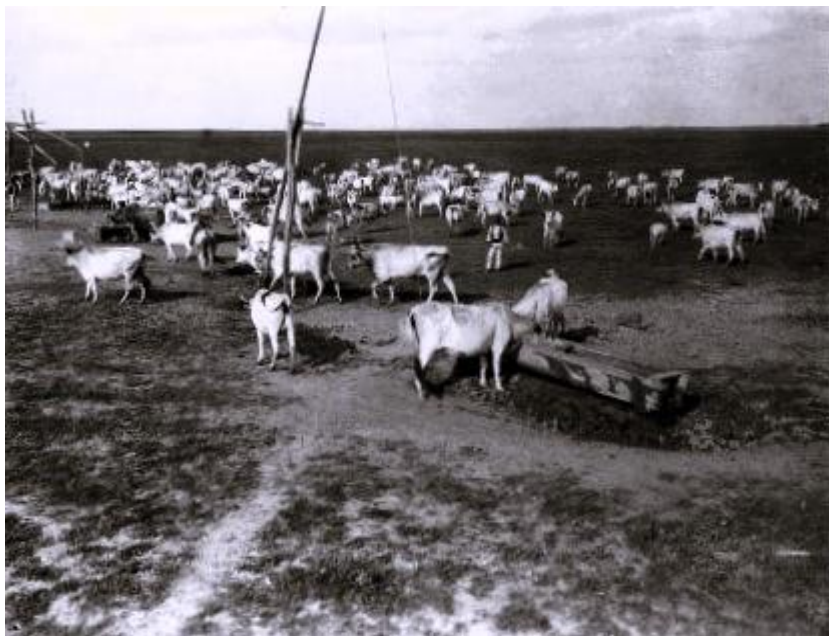
Tamaslâc (Cireadă) de vite la adăpat pe terasa Roseți