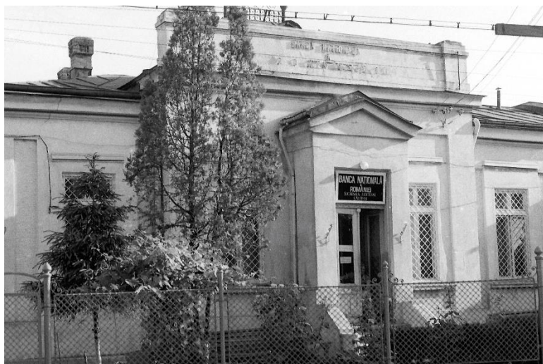
Casa Alexe Vineș, de pe strada București nr. 192 a fost construită în anul 1880 iar în anul 1905 clădirea a fost cumpărată de Banca Națională, care a funcționat aici până prin anii 1992-1993.