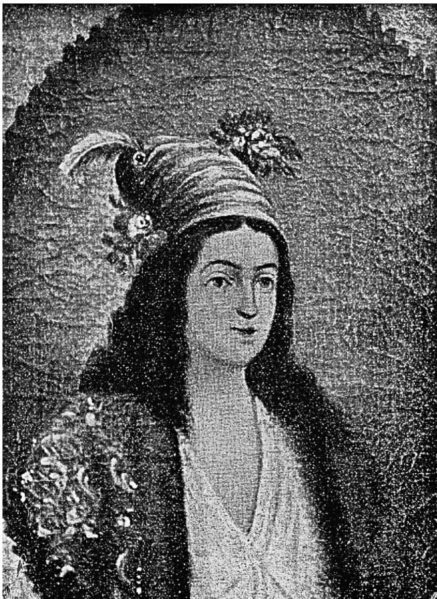
Domnița Florica, fiica lui Mihai Viteazul, singurul tablou cunoscut al pictorului Constantin Predeleanu