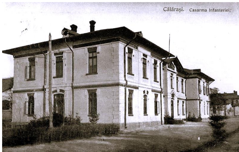
Cazarma Regimentului 23 Infanterie ridicată în anii 1880-1881. Localul se află azi în proprietatea Consiliului județean, a fost reabilitat și aici funcționează Serviciul județean de evidență a populației și Societatea comercială “Drumuri și poduri”