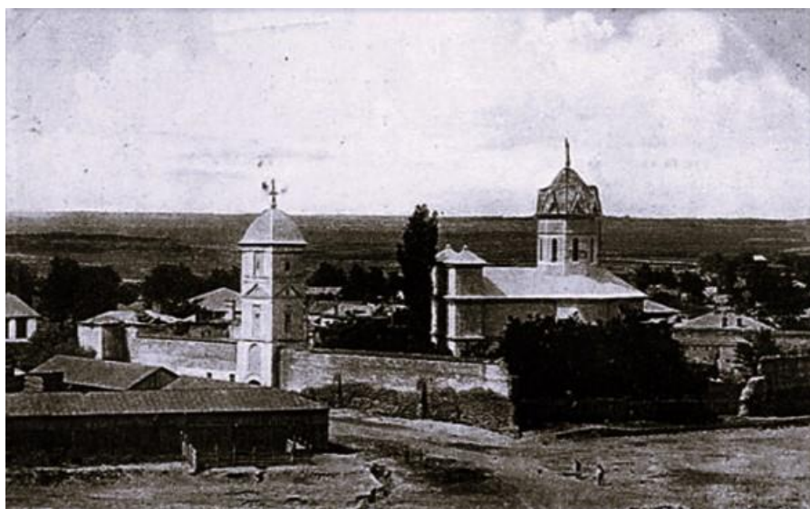
Mănăstirea lui Ianache de la Slobozia