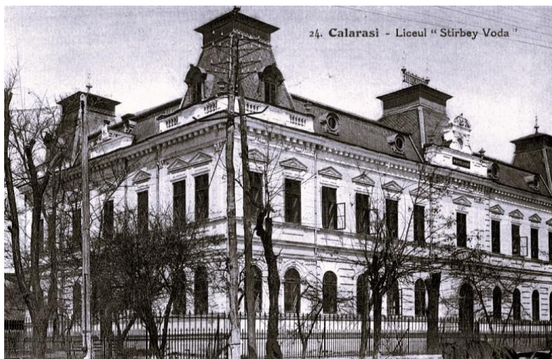
Localul școlilor de băieți nr. 1 și nr. 2, construit în anii 1881-1882. Din anul 1884 aici a funcționat Gimnaziul și mai apoi, din 1919, Liceul „Știrbei Vodă”