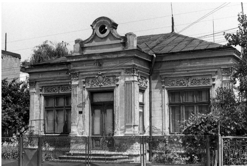
Fosta casă a primarului Panait Șerbănescu de pe str. București despre care Constantin Predeleanu ne spune că exista la 1884