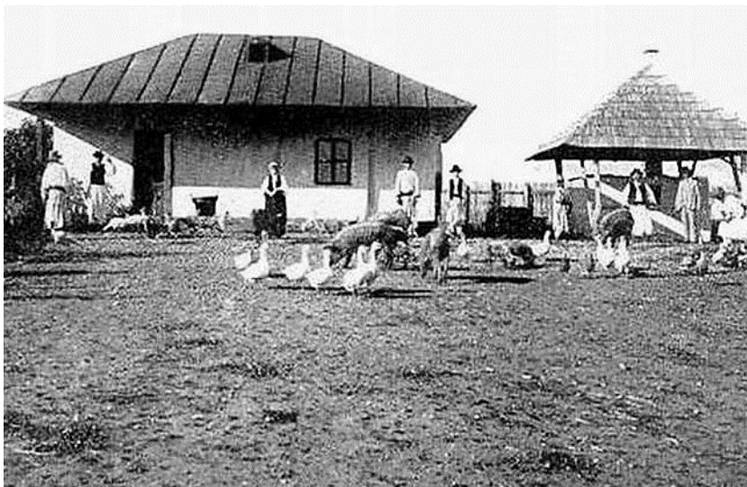
Gospodărie țărănească tradițională din Bărgan