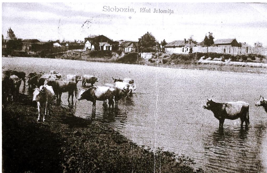
Râul Ialomița la Slobozia