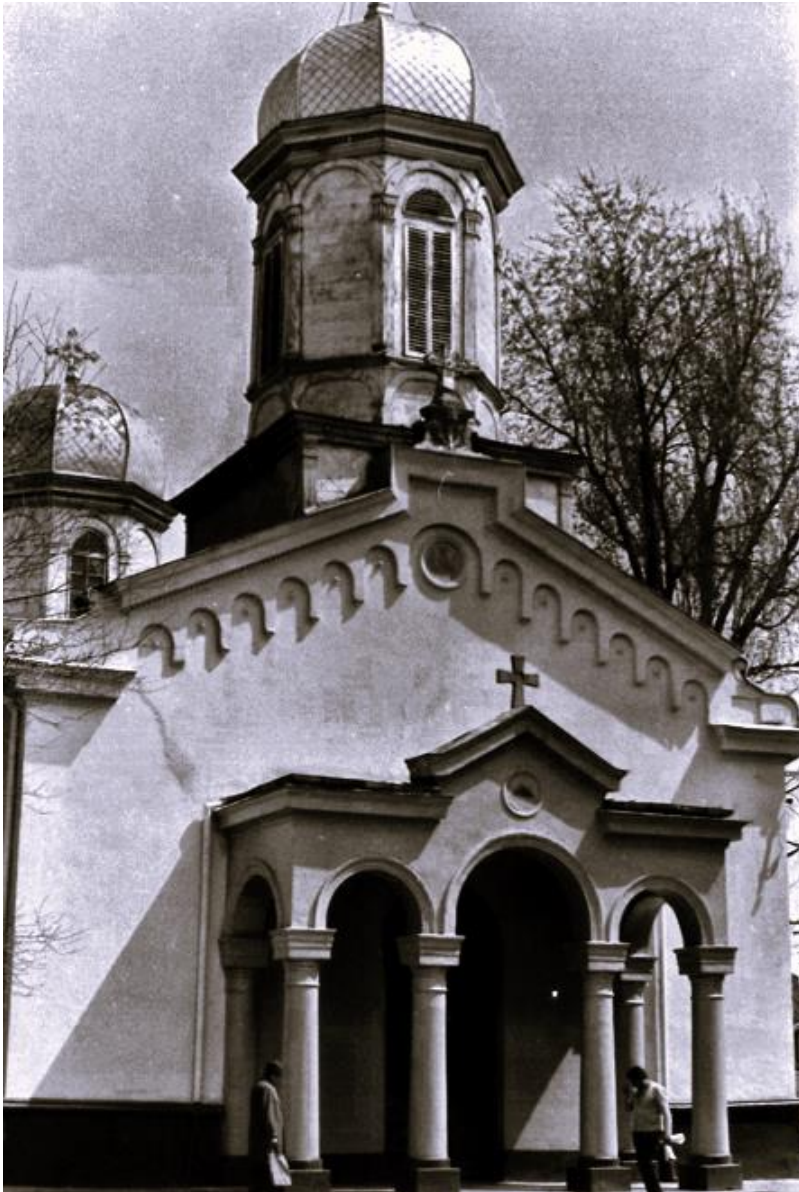
Biserica-Catedrală cu hramul Sf. Nicolae reclădită de polcovnicul Grigore Poenaru în anul 1836. Templul și Catapeteasma bisericii au fost repictate în anul 1894 de pictorul Constantin Predeleanu