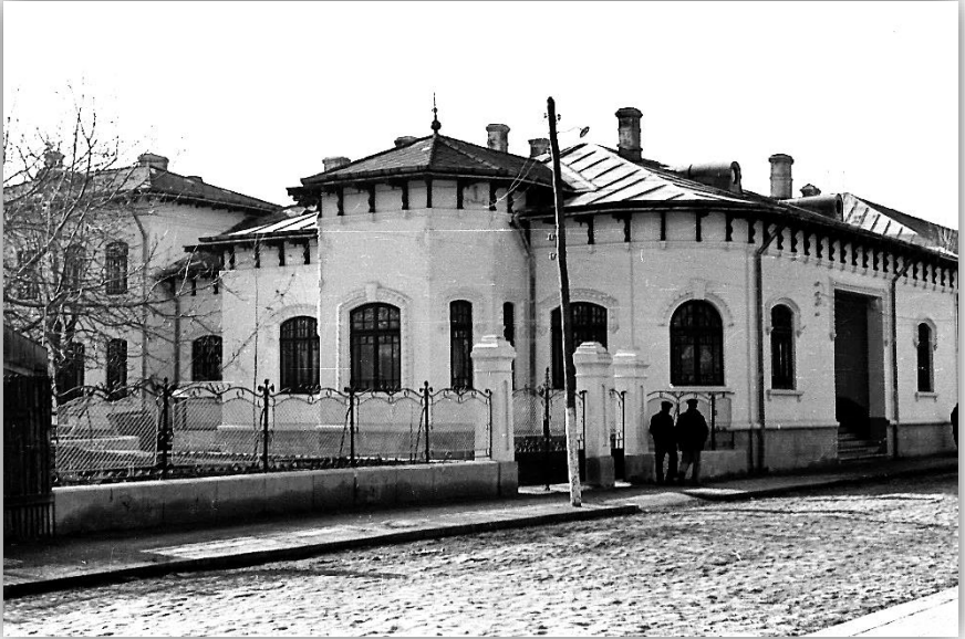
Muzeul Dunării de Jos Călărași