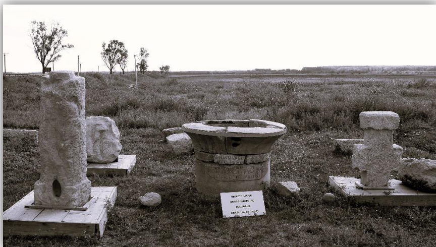
Vestigii arheologice de la Orașul de Floci