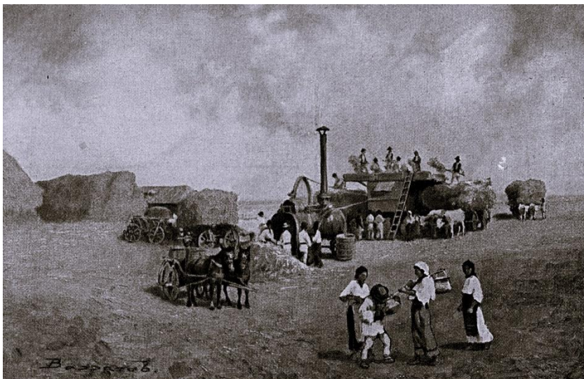
La treierat în Bărăgan. Pictură de Ludovic Basarab